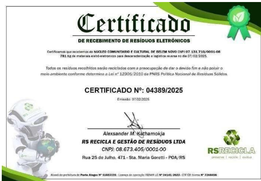
Certificado de Descarte Correto de Resíduos Eletrônicos