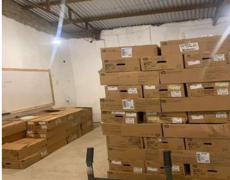
Material Recebido Caixa Federal