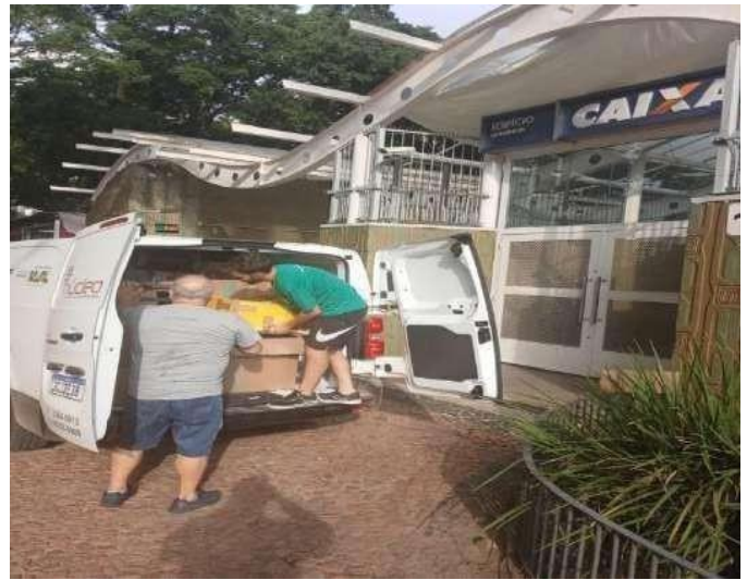
Busca de Computadores Caixa Federal