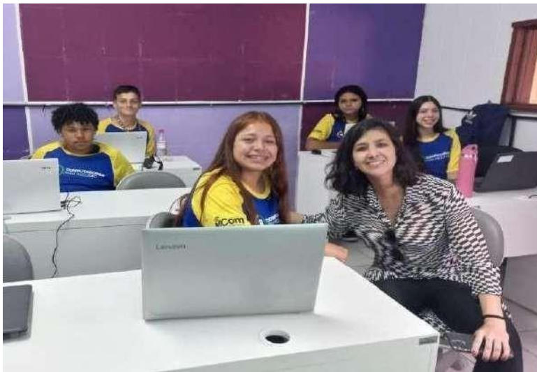
Turma de Inf Básica